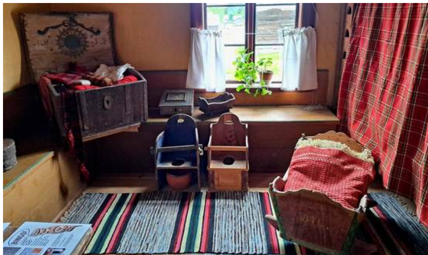
På Stundars passade vi på att göra en liten tillfällig utställning i den nyrenoverade framstugan med målade möbler och fästmansgåvor.

I Stundars samlingspolitiska dokument definieras vårt samlingsuppdrag till den materiella och immateriella kulturen kring den förindustriella perioden i svenska Österbotten 1870-1920, främst då kring österbottniskt byggnadsarv och traditionella hantverk och arbetsmetoder. Stundars använder samlingshanteringsverktyget MuseumPlus för hanteringen av föremålssamlingen.