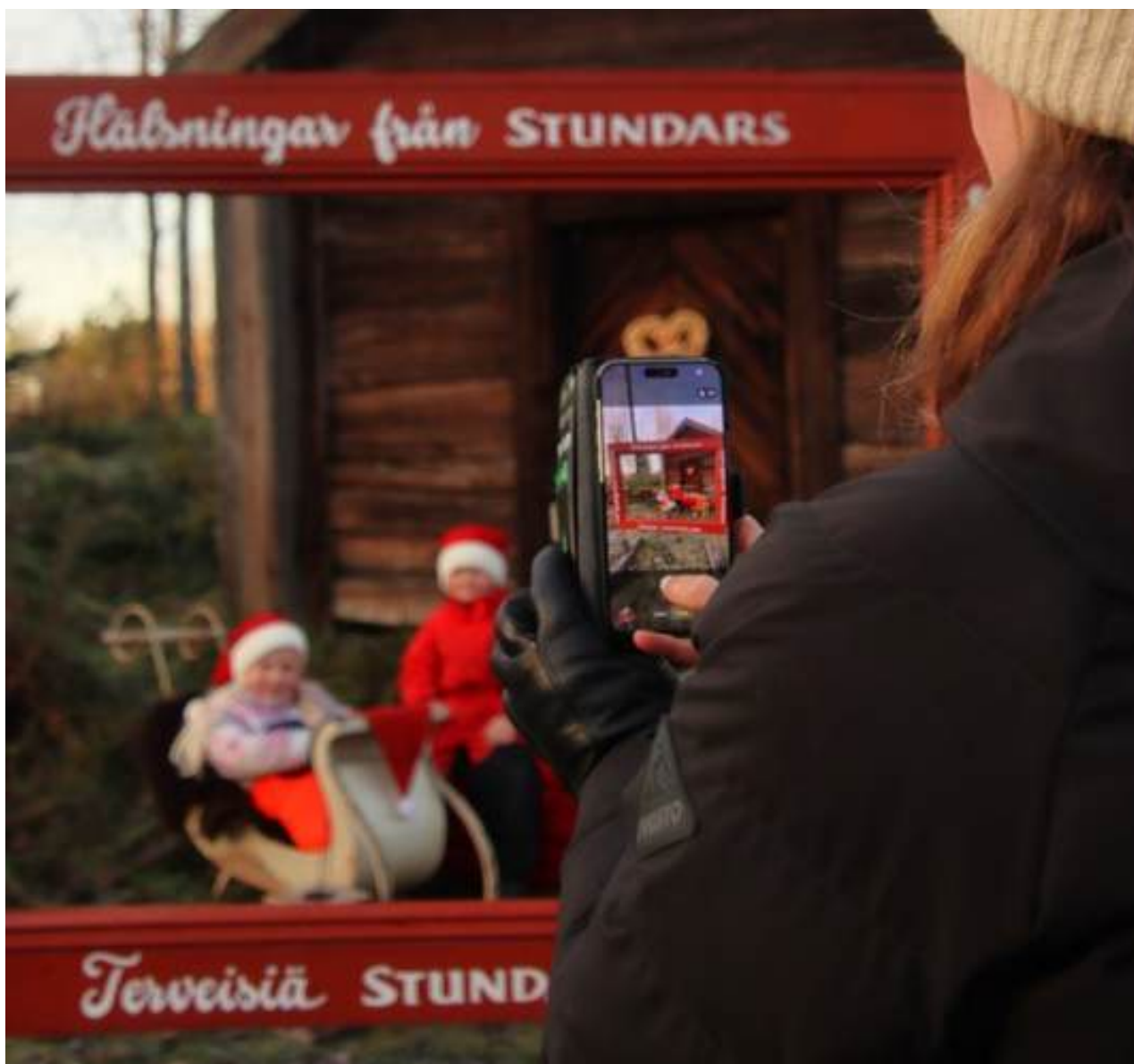
Selfie-ramen blev välanvänd under årets snöfria julmarknad.