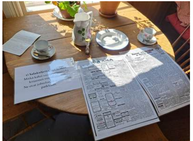
Kaffi tå! är ett räddningsäventyr på 60 minuter för max 12 personer som vi utvecklat tillsammans med BBH.