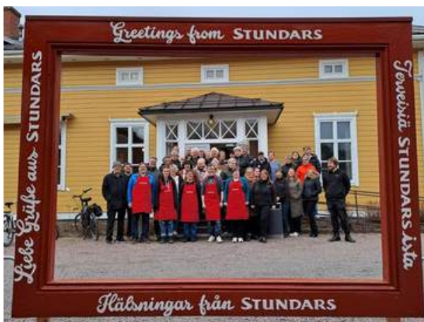
Stundars styrelse, personal och frivilliga invigde vår nya selfie-ram under talkomiddagen 3.4.