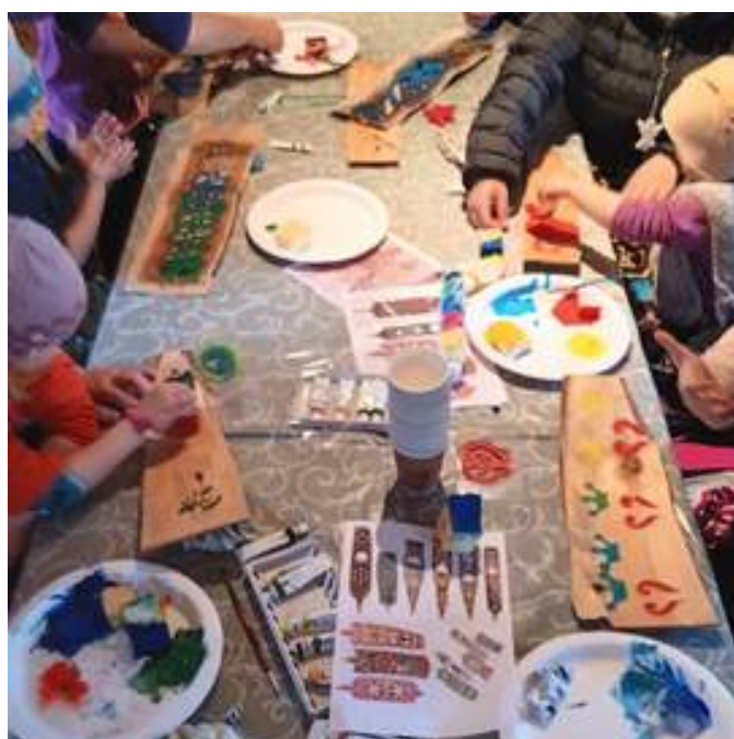
Under Höstbestyr på höstlovet och under Julvandringen fick stora och små besökare pröva på att trycka med schabloner på pärtor.