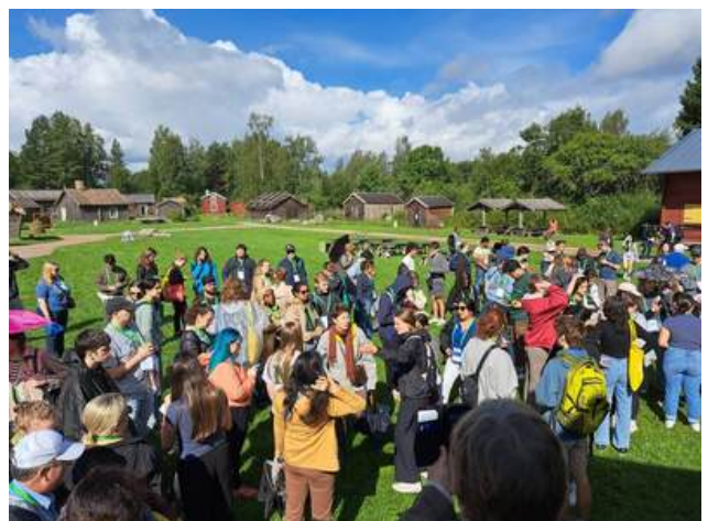
180 utländska studeranden intog museibyn i augusti.