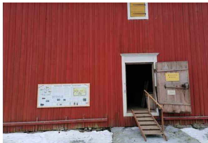
Skyltar som berättar om sockenmagasinens historia och funktion har monterats till både Solf och Gamla Vasa sockenmagasin.