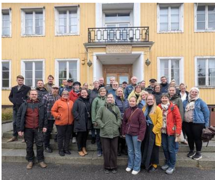
Byggnadsvårdsresan till Västerbotten 3-5.10.2025 hade 32 deltagare. Vi besökte Vindelns hembygdsförening, Vindelns folkhögskola samt flera privata gårdar och hem.